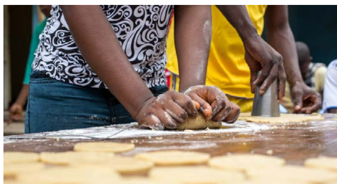
Niños soldados desmovilizados de la milicia del líder tradicional Kamuina Nsapu hacen galletas en un centro de tránsito y orientación gestionado por la ONG local Children Catholic National Bureau, con el apoyo de UNICEF, en Kananga (República Democrática del Congo).

Descargar el informe completo [pdf] Descargar los resúmenes de la investigación