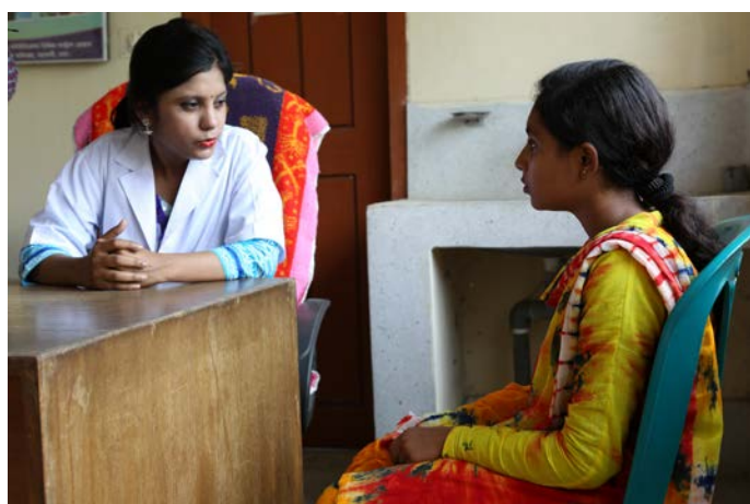
Una profesional médica asesora a una chica de 14 años sobre asuntos de salud sexual y reproductiva en el centro de salud Dacope Upazila de Bangladesh.

Los embarazos muy continuados exponen a las mujeres jóvenes y a sus hijos a múltiples riesgos sanitarios y socioeconómicos. En este examen de 40 evaluaciones de gran calidad se constata que la prevención eficaz vincula los servicios clínicos anticonceptivos con