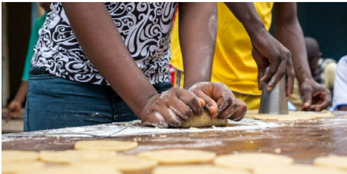
Des enfants soldats démobilisés de la milice du chef traditionnel Kamuina Nsapu préparent des biscuits dans un Centre de transit et d'orientation soutenu par l'UNICEF et dirigé par le Bureau national catholique de l'enfance, une ONG locale, à Kananga (République démocratique du Congo).