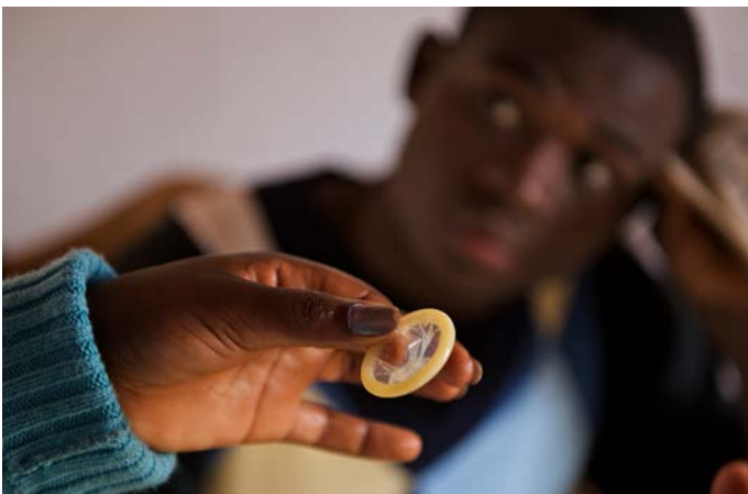
Un adolescent de 17 ans écoute l'une de ses camarades, conseillère jeunesse, lui parler de rapports sexuels sûrs et protégés, à l'Organisation de jeunes de Mitundu, à Lilongwe (Malawi).

sont correctement payés et qu'ils reçoivent des cours de perfectionnement pour les aider à améliorer la qualité de leur action. » Il est clair qu'un soutien continu et fort est essentiel à la réussite de ces initiatives relativement petites. Pour déployer ces interventions à plus grande échelle et les pérenniser, il faut répondre à deux questions fondamentales : les agents de première ligne existants – tels que les agents de vulgarisation sanitaire en Éthiopie et les militants certifiés de la santé sociale en Inde – seront-ils capables de prendre en charge ces tâches additionnelles difficiles ? Les gouvernements des pays à revenu faible ou intermédiaire seront-ils quant à eux capables de mettre en place les systèmes de soutien dont les « intervenants » ont besoin pour travailler efficacement au niveau des communautés et de leurs institutions (par exemple des écoles), et seront-ils disposés à le faire ?