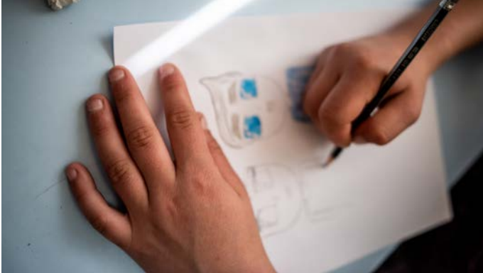
Une enfant de 12 ans dessine dans le bureau de son ancien psychologue dans un foyer financé par l'UNICEF, en République de Moldova (2018). Liza a été victime d'abus sexuels de la part de son beau-père et s'est rétablie grâce à l'aide de ce foyer, qui lui a fourni une aide médicale et un appui psychosocial.

UNICEF Innocenti : Quels ont été les moments forts de « Leading Minds » d'après vous ?